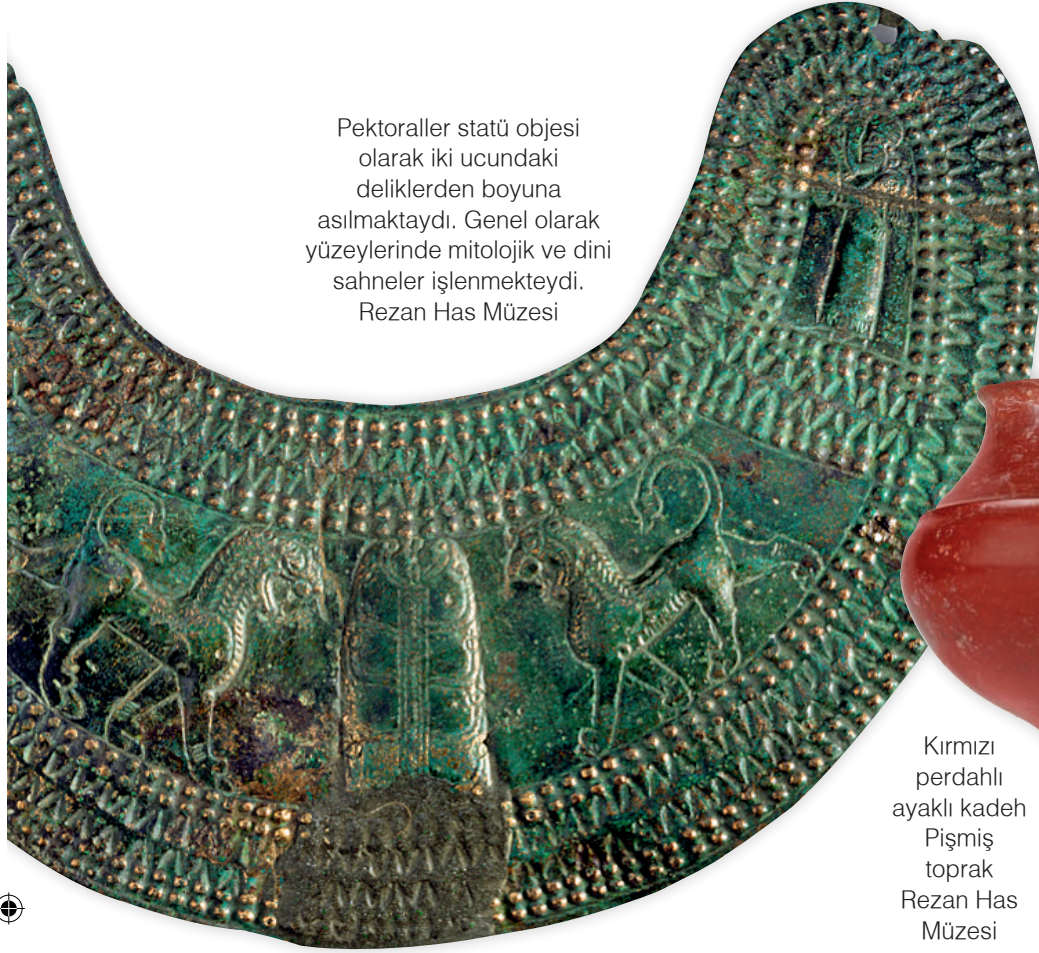
Pektoraller statü objesi olarak iki ucundaki deliklerden boyuna asılmaktaydı. Genel olarak yüzeylerinde mitolojik ve dini sahneler işlenmekteydi. Rezan Has Müzesi