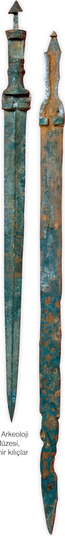
Van Arkeoloji Müzesi, Demir kılıçlar

uzak bölgelerden getirilen insanlar yerleştirilmekteydi. Urartu kentlerinin boyutları Ayanis örneğinde olduğu gibi 80 hektarı aşmakta, sitadellere bu alanın ancak birkaç hektarlık bölümünü oluşturmaktadır.