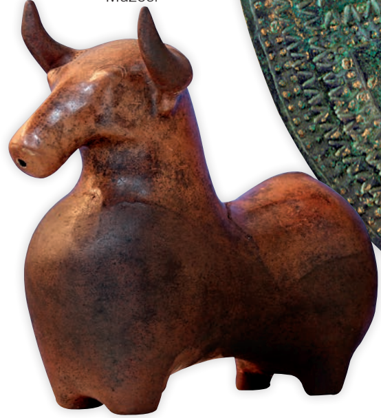
Pişmiş toprak rhyton (hayvan biçimli törensel içki kabı) Van Arkeoloji Müzesi

yıllıkları yer almaktadır. Bunların planı, girişte bir platform, büyük bir kapı ile geçilen geniş bir ana oda ve bu odanın çevresindeki yan oda veya odalardan oluşur. Oda sayısı Van/İçkale ve Argiştı Mezarı'nda olduğu gibi en çok 6-7 kadardır. Ana odalar birçok mezarda, Neftkuyudaki gibi 90 metrekareyi aşmakta ve törensel boyutlara ulaşmaktadır. Ayrıca mezar odalarının birçoğunun yan duvarlarında sekiler ve nişler yer alır.