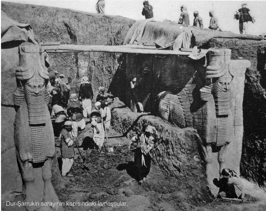
Dur-Şarrukin sarayının kapısındaki lamaşşular.

II. Aşurnasirpal tarafından Assur Krallığı'nın yeni başkenti olarak inşa edilen Kalhu kentindeki Kuzeybatı Sarayı'nın taht odasının A.H. Layard tarafından yapılan resmi. Duvarlar, üzerlerine kralın kazandığı başarılar, av sahneleri, kanatlı cinler, hayat ağaçları işlenmiş taş kabartmalarla süsli'dür. Temsili resimde ortadaki kral vezirine direktif vermekte, arkasında sakalsız bir hadım görevli durmakta, sol tarafta da iki yazıcı ve bir saray görevlisi emirleri kaydetmektedir. Birçok yeni Assur kabartmasında gösterildiği gibi yazıcılardan biri çivi yazısıyla kil tablete, ikincisi ise alfabe yazısıyla (Aramice), papirüs üzerine yazmaktadır.