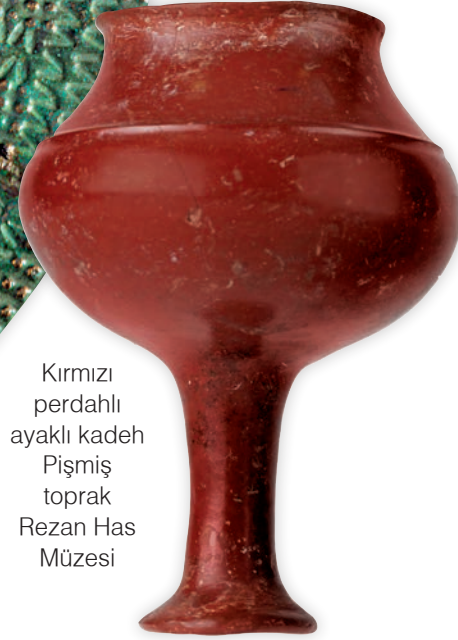
Kırmızı perdahlı ayaklı kadeh Pişmiş toprak Rezan Has Müzesi