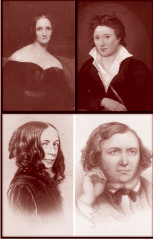
Resim 2: Üstte: Mary Shelley ve Percy Bysshe Shelley. Altta: Elizabeth Barrett Browning ve Robert Browning