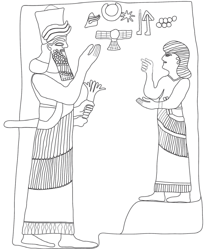
Resim 8 - Karabur 2 kabartması, tanrı ve hadım görevli

Assur eyaletlerinde, III. Şalmaneser dönemi sonrasında eyalet valilerinin etkin olduğu MÖ 8. yüzyılda, siyasal gelişmeye paralel olarak kabartmalara ve stellere hadım eyalet valilerinin betimleri de yansımıştır.