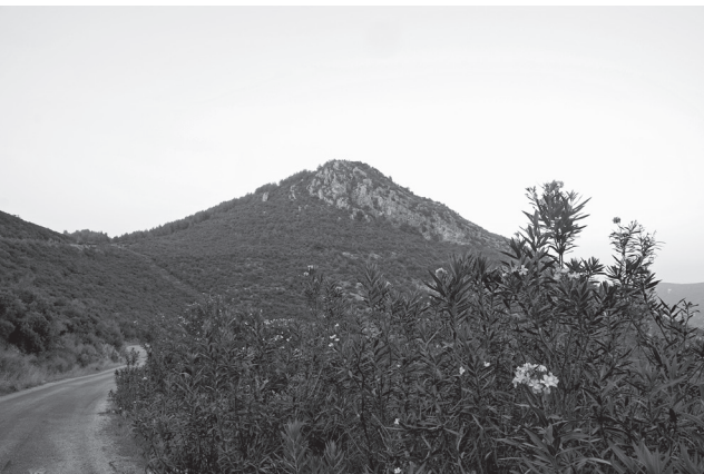
Resim 5 Ferhatlı- Uzunoğlan Tepe kabartmasının bulunduğu zirve

yükselen bir sütun ve en tepede Tanrı Sin'in sembolü hilal betimlenmiştir. Hilalin altından her iki yandan püsküller sarmaktadır. Tanrı Sin'in Anadolu'da, kültür merkezinin bulunduğu Harran ve çevresinde, Geç Hitit ve Arami kentlerinde kutsandığı bilinmektedir. Yeni Assur kralları, Anadolu halkı üzerindeki etkinliklerini artırmak için Tanrı Sin'e yakınlıklarını Sultantepe ve Aşağı Yarımcı stelleri gibi örnekler aracılığıyla vurgulamış olmalıdır.