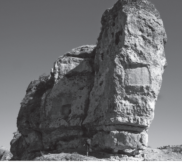
Resim 9 - Eğil kabartması

kabartmalarından ikincisinde ise tanrının karşısında yalnızca eyalet valisi resmedilmiştir (Resim 7-8). İki figürün arasında tanrı ve tanrıça sembolleri yer alır. Karabur'da toplam dört kabartma birbirinden bağımsız kaya yüzeylerine yapılmıştır. Diğer üç kabartmada tek başına duran bir tanrı betimlenmiştir.