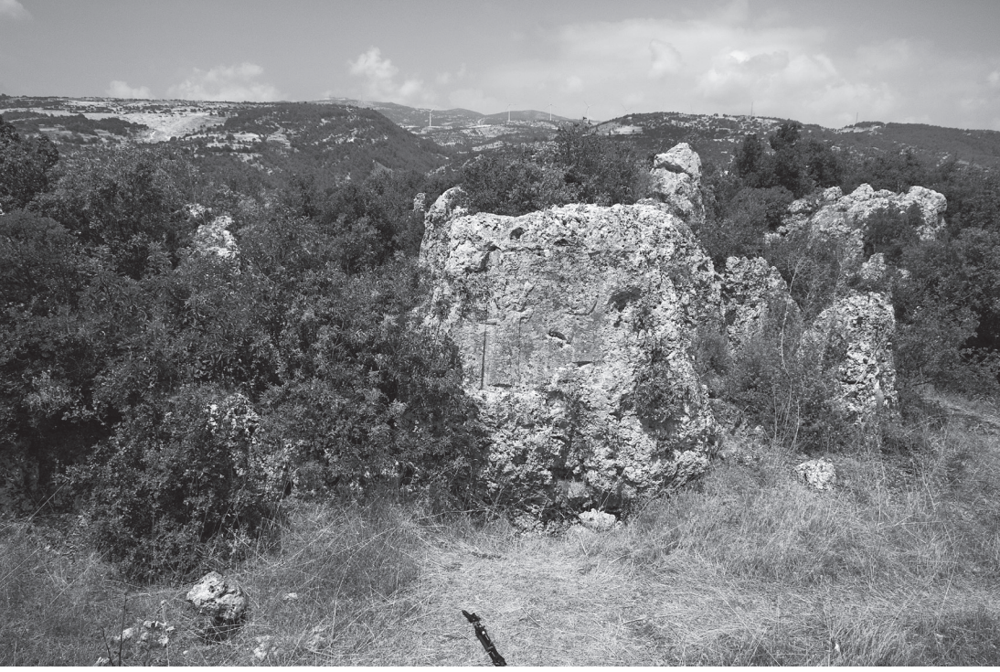
Resim 7 Antakya-Karabur 2 kabartması

Üçüncü grupta Assur Ülkesi dışında olduğu dönemde, Fırat'ın batısında, Geç Hitit kent devletleri arasındaki sınır anlaşmazlıklarını sona erdiren çözümün bir parçası olarak dikilen Kahramanmaraş/ Pazarcık ve Antakya stelleri sayılabilir. Her iki yazıtlı stel üzerinde Sin stellerinde olduğu gibi hilal betimlenmiştir. Bu tür stelleri eyalet valisinin yaptırdığı, hatta bazılarını yerel ustaların yaptığı söylenebilir.