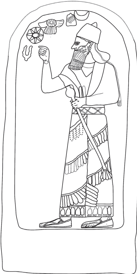
Resim 1 Kurkh Monoliti, II. Aşurnasirpal

Yeni Assur dönemine ilişkin olarak Anadolu'da keşfedilen 10'un üzerinde stel ve stel parçası, yapılmış amaçlarına göre birkaç grupta değerlendirilebilir. İlk grupta eyalet merkezlerinde dikilen steller yer alır. Diyarbakır/ Üçtepe höyüğünde bulunan ve günümüzde British Müzesinde sergilenen II. Aşurnasirpal (Resim 1) ve III. Şalmaneser'in yaptırdığı Kurkh Stelleri ve Şanlıurfa/ Zincirli höyükten Almanya'ya Münih Müzesine götürülmüş olan Esarhaddon steli bu grubun temsilcileridir. Bu steller, sitadelde inşa edilen eyalet sarayının girişine yerleştirilmişlerdir. Bulunduğu yerdeki Yeni Assur yapıları hakkında araştırma yapılmamış olmakla birlikte Türkiye Suriye sınırındaki Babil köyünden Adana Müzesine taşınmış II. Aşurnasirpal Steli'ni de bu grupta sayabiliriz. Hepsi başkentten getirilen sanatçılara, başkent üslubunda yaptırılmıştır. Kurkh stellerini British Müzesinde yaptığımız gözlemler ve çektiğimiz resimler üzerinden, Zincirli steli ise yayınlardaki resimlerinden yeniden çizdik.