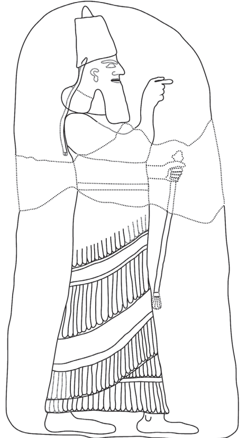
Resim 6 Ferhatlı- Uzunoğlan kabartması, III. Şalmaneser