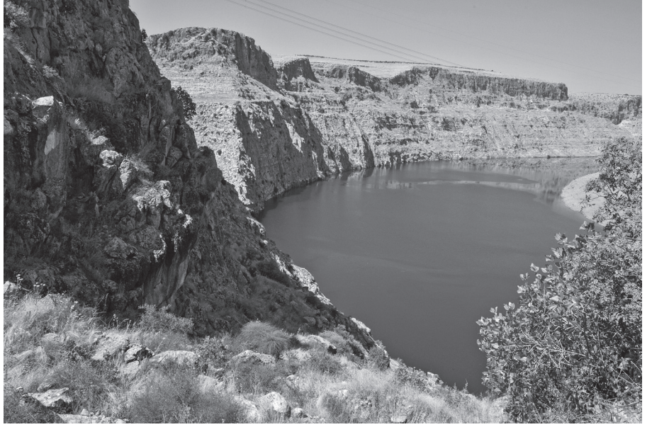
Resim 4 - Kenk Boğazı kabartmasının önünden Fırat Vadisi

Stellerde kral, kutsal törenlerde giydiği elbisesi, şalı, başında sivri çıkıntısı olan başlığı, ayaklarında sandaleti veya çizmesi ve sol elinde asası ile resmedilmiştir. Sağ eli her zaman başının önünde yer alan tanrı ve tanrıça sembollerini işaret eder durumdadır. Steller üzerindeki çivi yazılı kitabeler tanrılara övgü, kralı yücelten ifadeler ve kazanılan başarıları anlatır. Bunlar, kralı ve tanrıları yüceltmek, ziyarete gelenlere ülkenin sahibini hatırlatmak amacıyla yeni inşa edilen eyalet merkezlerinin giriş kapısına yerleştirilmişlerdir. Zincirli stelinde, diğerlerinden farklı olarak, Esarhaddon'un önünde, ele geçirilmiş olan iki kral aşağılanmış bir biçimde gösterilmiştir. Ayrıca kralın arkasında ve önünde, stelin yan yüzlerine Esarhaddon'un iki oğlu betimlenmiştir. Anlaşıldığı kadarıyla bu gruptaki steller, Assur'un propaganda araçlarından biriydi ve doğrudan kralın direktifiyle onun beğenisine uygun olarak yapılmaktaydı.