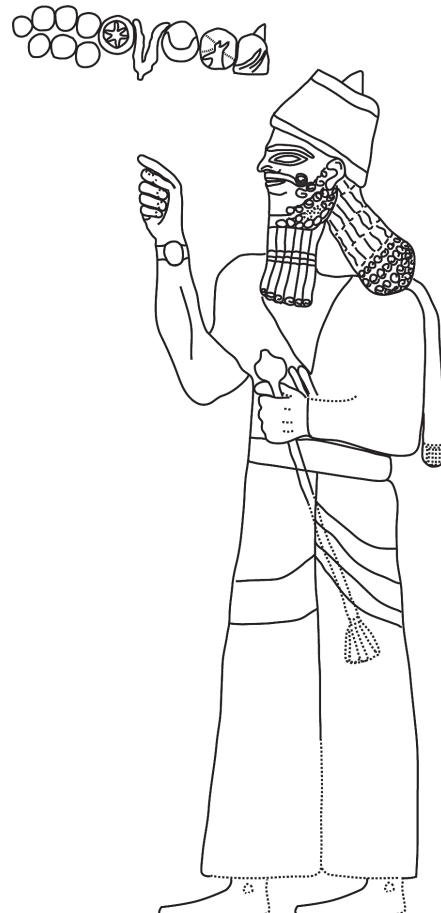
Resim 2 Kenk Boğazı kabartması, III. Şalmaneser