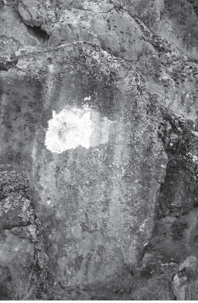
Resim 3 - Kenk Boğazı kabartmasının tahrip edilmiş yeri